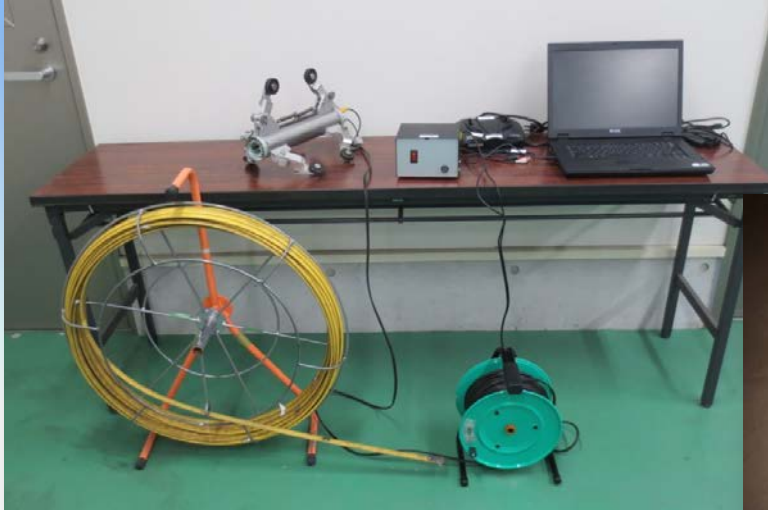
カメラシステム一式