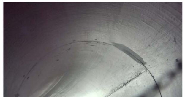
エポタール塗装配管内面画像