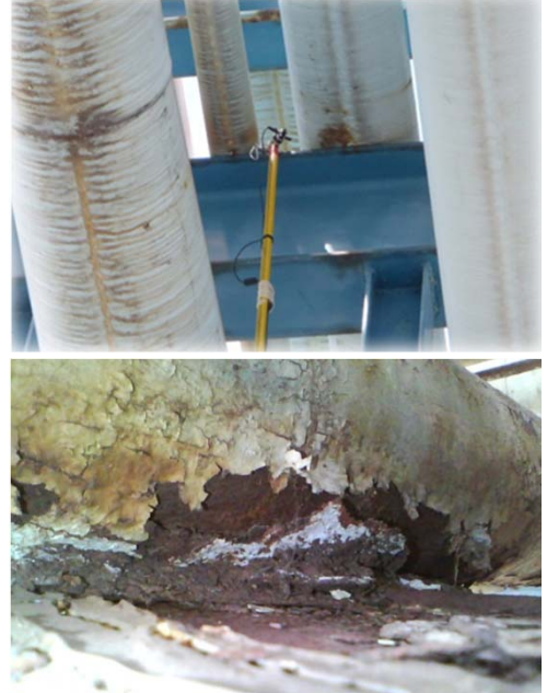
スケール付着による外面腐食の懸念

高所や狭所などの直接アクセスが困難である箇所を対象に、付帯工事を最小限に抑え、低コストでスピーディーに点検可能な装置です。広範囲にわたる配管の腐食状況を1次検査として目視確認でき、漏洩する危険性の高い部位を特定し、設備の安全を確保します。